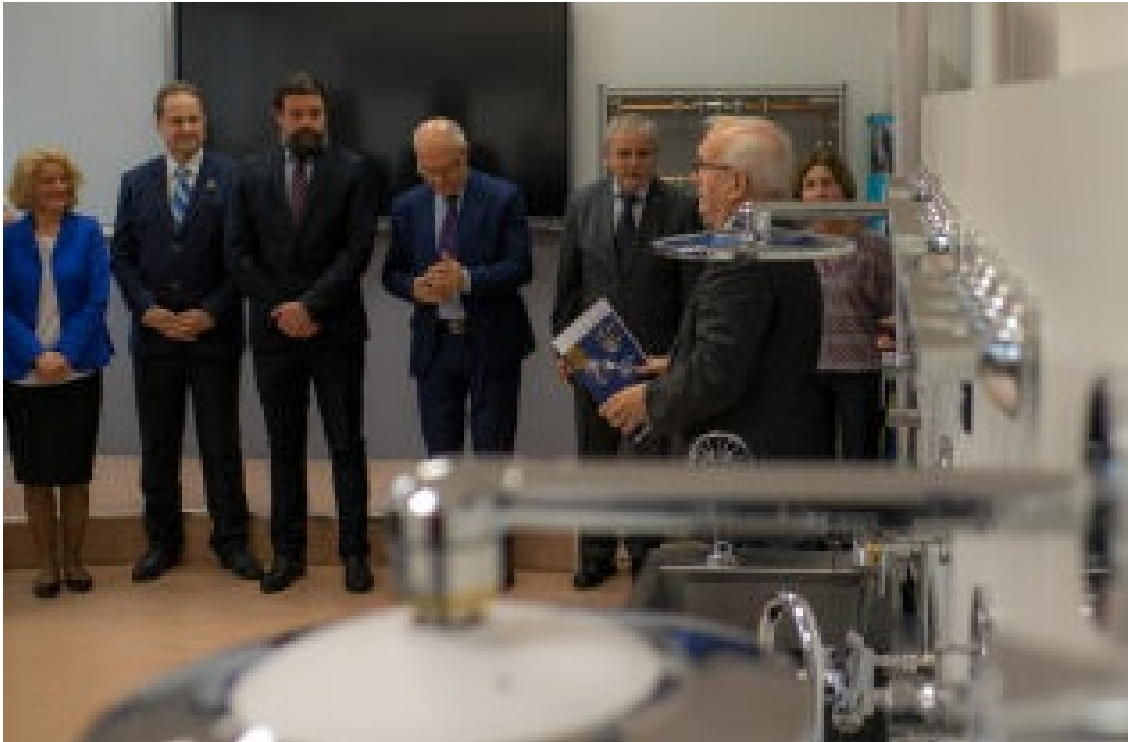
Nowoczesna pracownia wesprze edukację fachowców w branży sanitarnej